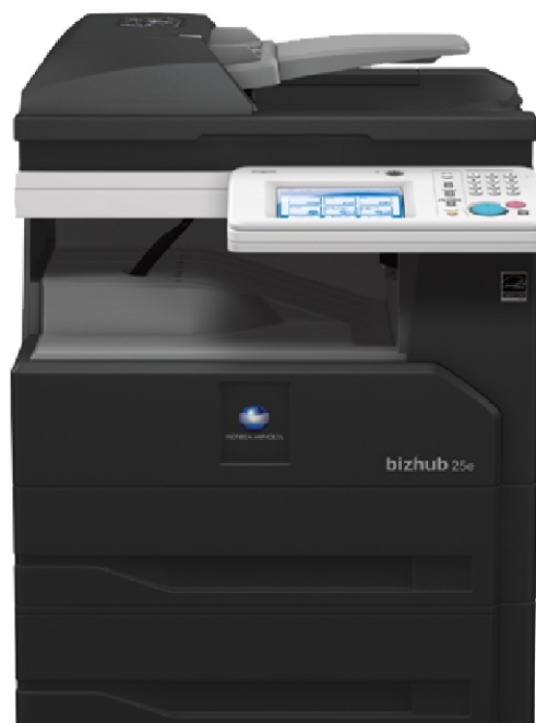
Imaginea este cu titlu de prezentare